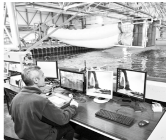
Bassins de la Centrale Nantes

Des entreprises historiques comme Naval Group ou les Chantiers de l'Atlantique, partagent avec de nouvelles pépites comme WISAMO, Airseas, Neoline, VPLP ou D-Ice Engineering, l'ambition d'expérimenter et de développer de nouvelles solutions pour une construction navale et un transport maritime moins impactant pour l'environnement et moins gourmand en énergie. La dynamique nantaise sur le sujet est fortement liée à la présence de réseaux structurants, comme Wind Ship, MEET2050, le tout nouvel institut pour la décarbonation du transport maritime ou le Cluster de recherche CARGO, et à la présence d'une ingénierie de recherche et d'innovation locale de haute performance, comme, par exemple, les bassins de Centrale Nantes qui permettent d'expérimenter l'hydrodynamique et le génie océanique. Le succès des deux éditions de Wind For Goods, l'événement organisé par Nantes Saint-Nazaire Développement qui rassemble les actrices et les acteurs du transport vélique à Saint-Nazaire, vient confirmer à la fois l'ambition et le rayonnement du territoire en la matière. ■