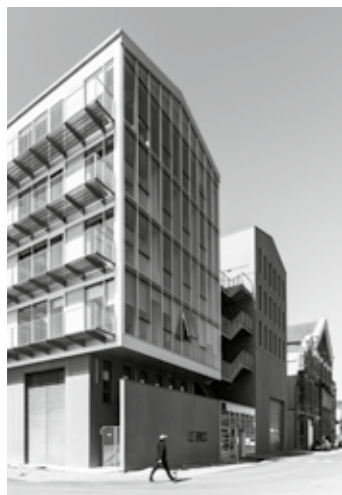
Le Brick - Photo : Céline Jacq

« Le territoire nantais dispose d'une véritable capacité à faire émerger et à « derisquer » d'un point de vue technologie, marché ou financement, des projets de propulsion des navires par le vent, de l'idée jusqu'aux essais de maquettes. Cette capacité naît de la présence de nombreux acteurs locaux, appuyés par un écosystème local soutenant l'innovation qui permet à Nantes d'accueillir de belles aventures du transport maritime à la voile. »