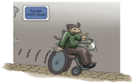
B) Massage fessier reconstituant ...